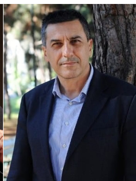
Δημήτριος Κουρέτας Καθηγητής Φυσιολογίας Ζωικών Οργανισμών και Τοξικολογίας, Ιδρυτής FoodOxys