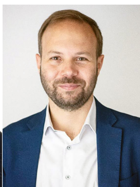
Γιώργος Ψυχογιός Βουλευτής Κορινθίας ΣΥΡΙΖΑ-Π.Σ.