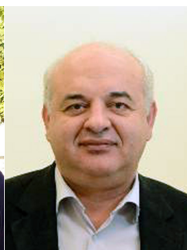
Νίκος Καραθανασόπουλος Βουλευτής Αχαΐας ΚΚΕ - Κοινοβουλευτικός Εκπρόσωπος