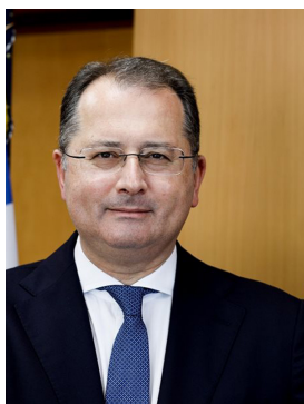
Γεώργιος Στύλιος Υφυπουργός Αγροτικής Ανάπτυξης και Τροφίμων