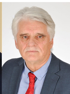
Σπύρος Μυλωνάς Δήμαρχος Δυτικής Αχαΐας