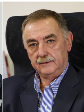
Παναγιώτης Τσιχριτζής Πρόεδρος Επιμελητηρίου Αιτωλοακαρνανίας