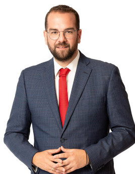
Νεκτάριος Φαρμάκης Περιφερειάρχης Δυτικής Ελλάδας