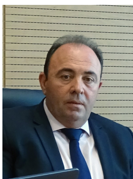
Ανδρέας Φίλιας Αντιπεριφερειάρχης Οικονομικής Πολιτικής και Δημοσιονομικού Ελέγχου