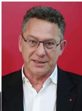
Κώστας Αρβανίτης Ευρωβουλευτής ΣΥΡΙΖΑ-Προοδευτική Συμμαχία