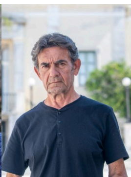
Βαγγέλης Πολίτης-Στεργίου Δρ. Ανθρωπιστικών Επιστημών, Ομότιμος Καθηγητής, πρόεδρος Αχαϊκής Εταιρείας Μελετών