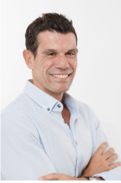
Λοκούργος Σταυρουλόπουλος Περιφερειακός Σύμβουλος, Οικονομολόγος Ε.Υ.Δ. Περιφέρειας Δυτ. Ελλάδας, Υπεύθυνος Στρατηγικής Έξυπνης Εξειδίκευσης