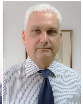
Φωκίων Ζαΐμης Αντιπεριφερειάρχης Π.Ε Αχαΐας