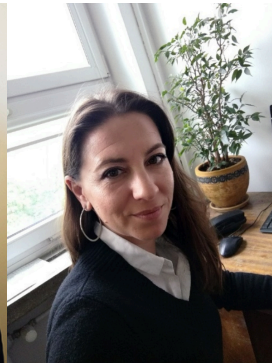
Ιωάννα Παπαβασιλείου Επίκουρη Καθηγήτρια Τμήματος Χημικών Μηχανικών του Πανεπιστημίου Πατρών