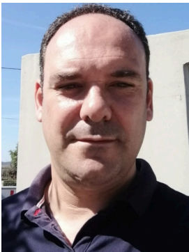
Διονύσιος Κλάδης Πρόεδρος ΔΕΥΑΠ