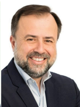
Στυλιανός (Λιός) Μπλέτσας Αντιπεριφερειάρχης Βιώσιμης Ανάπτυξης και Περιβάλλοντος