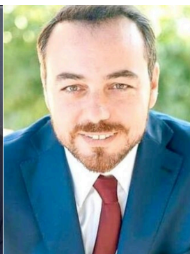
Φραγκίσκος Παρασύρης Βουλευτής Ηρακλείου ΠΑΣΟΚ-Κίνημα Αλλαγής