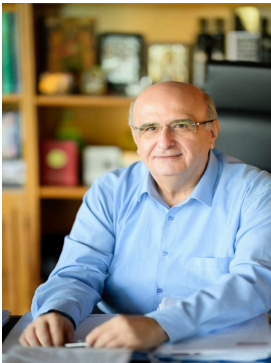
Χρήστος Μπούρας Καθηγητής, Πρόεδρος Πανεπιστημίου Πατρών