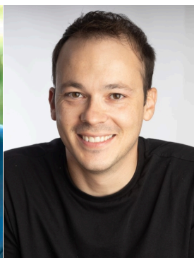
Μιλιτιάδης Ζαμπάρας Βουλευτής Αιτωλοακαρνανίας ΣΥΡΙΖΑ-ΠΣ, Αναπληρωτής Κοινοβουλευτικός