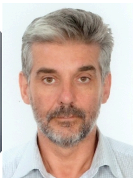
Δημοσθένης Πολύζος Καθηγητής του Τμήματος Μηχανολόγων Μηχανικών και Αεροναυπηγών του Πανεπιστημίου Πατρών