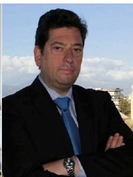
Δημήτριος Παλούμης Ελληνική Λύση-Κυριάκος Βελόπουλος