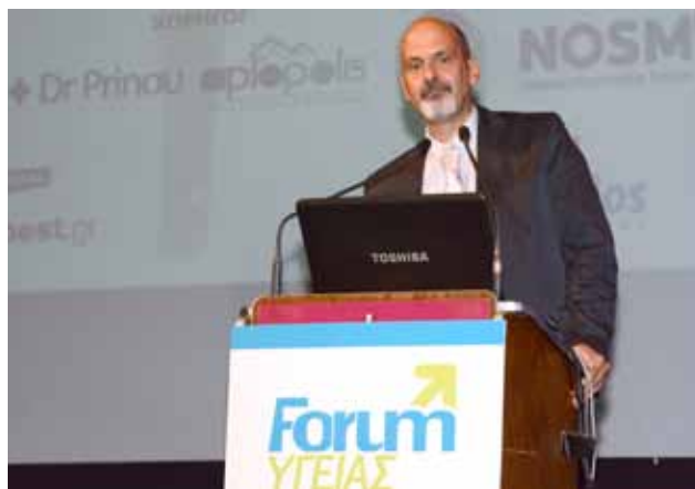
Ο κ. Χαράλαμπος Μπονάνος, Αντιπεριφερειάρχης Π.Ε Αχαΐας