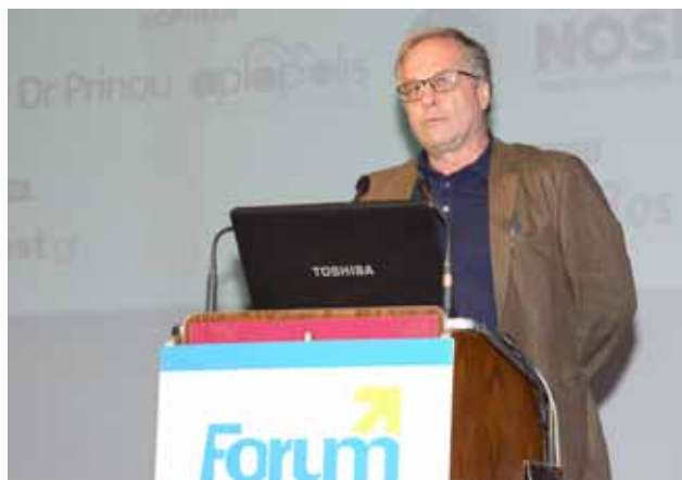
Ο κ. Κωνσταντίνος Μάρκου, βουλευτής Αχαΐας του ΣΥΡΙΖΑ