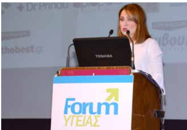
Η κα Χριστίνα Αϊεξοπούλου, βουλευτής Αχαΐας της ΝΔ,